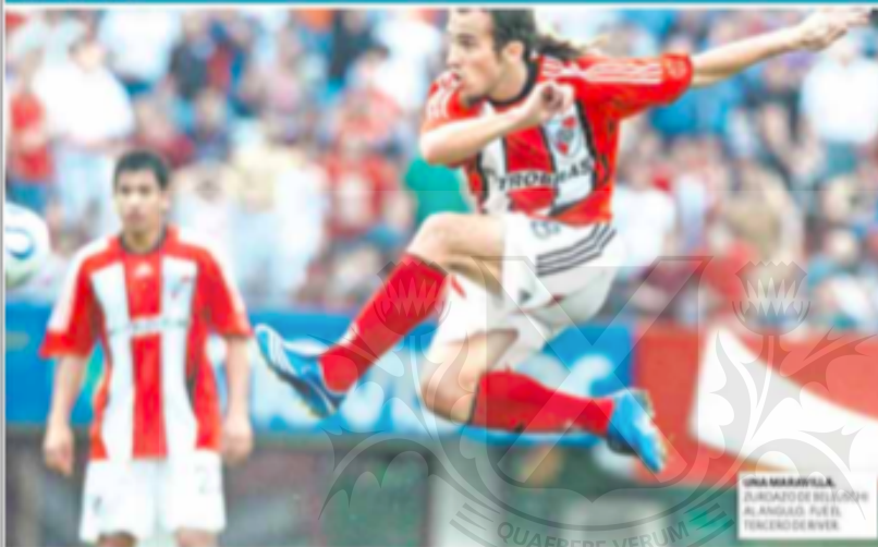
UNA MARAVILLA. FUNDADO DE BELUSCHI AL ANILLO. FUE EL FINCERO DE RIVER