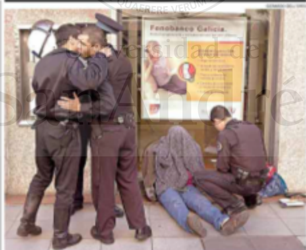
El deber cumplido ► Dos policías se abrazan luego de atrapar a un delincuente. Todo empezó con el robo a un banco en el microcentro. Y siguió con la odisea de un rehén y troteos en la calle. Terminó con otro ladrón agredido en un taxi. P.34