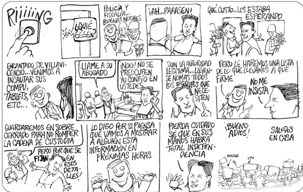
Policía y Fiscalía allanan domicilio de Villavicencio e incautan sus tablets, computadoras, celulares.