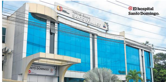
El hospital Santo Domingo.