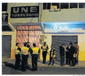
AMBATO. El FCME en la capital de Tungurahua opera en la sede de la UNE. A nivel nacional, 12 registran esta situación.

El Banco del Instituto Ecuatoriano de Seguridad Social (Bies) dispuso el traslado de ocho oficinas provinciales del Fondo de Cesantía del Magisterio Ecuatoriano (FCME), de las 27 a nivel nacional. Seis ya se mudaron a dependencias locales del IESS, y dos prevén hacerlo "en los próximos días", informó la institución en un boletín. Allí se argumentó que la medida busca "brindar una mejor atención a los afiliados". Esto se produce luego de que el banco asumió la gestión del fondo, el pasado 14 de mayo, amparado por una ley que así lo permite cuando se determinan recursos públicos.