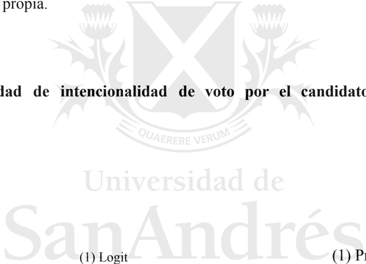
Tabla 7: Probabilidad de intencionalidad de voto por el candidato opositor (efectos marginales).