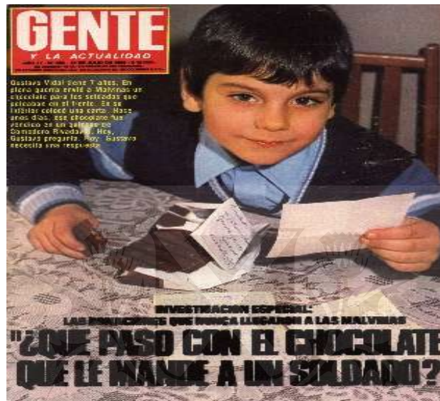
Revista Gente y la actualidad . n° 886, 15 de julio de 1982.

Un ejemplo es la portada del nene preocupado porque ninguna de las cosas que le había enviado al padre, llegaron. Esto, durante la guerra no se hubiese representado.