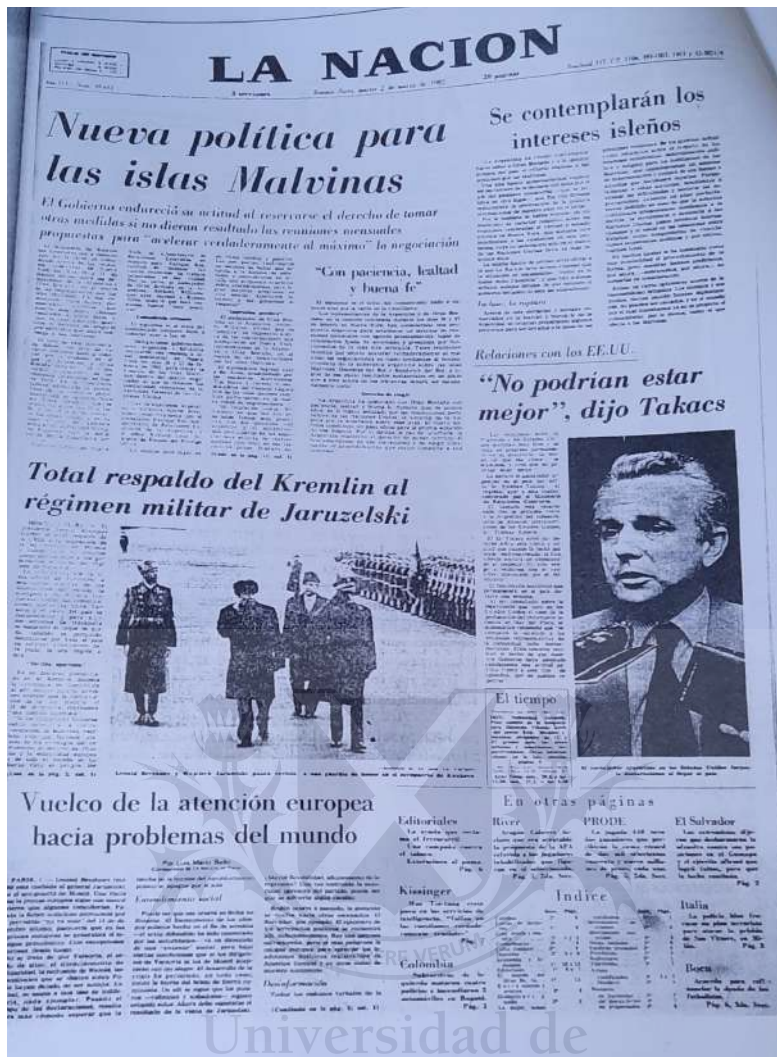
Diario La Nación, 2 de marzo de 1982.

La dictadura imperante no sólo limitaba las libertades individuales sino también la libertad de expresión y de prensa. Hubo ataques a periodistas opositores, algunos incluso fueron detenidos y se permitía que, solo algunos aceptados por el gobierno, sean los encargados de brindar las noticias. La manipulación de la información era casi completa y la sociedad no tenía forma de corroborar la información, la que terminaba por aceptarla como verídica.