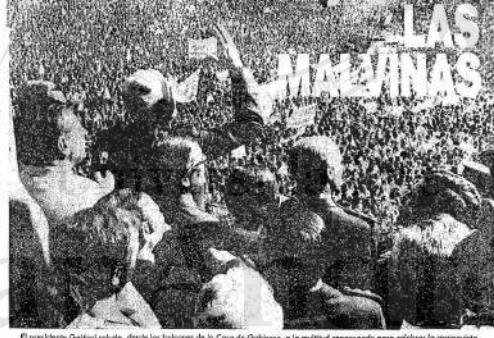
El presidente Galtieri saluda, desde los balcones de la Casa de Gobierno, a la multitud congregada para celebrar la recuperación.

Londres rompió relaciones con la Argentina