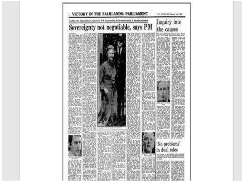
The Guardian, 16 de junio de 1982

La siguiente portada del Diario Clarín, del 13 de abril de 1982, nos demuestra como la imagen puede ser distorsionada.