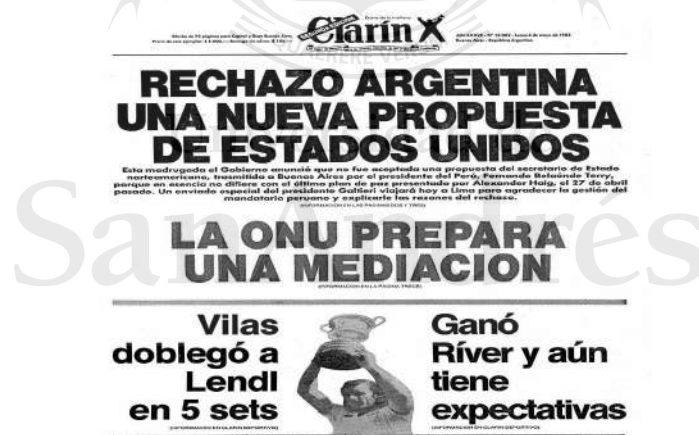
Diario Clarín, 3 de mayo de 1982

Si bien Malvinas, en un primer momento, captaba la atención de la totalidad de los medios, en un afán de lograr apoyo al gobierno de facto. Con el correr de la guerra y la proyección de un resultado desfavorable, la agenda viró a otras temáticas.