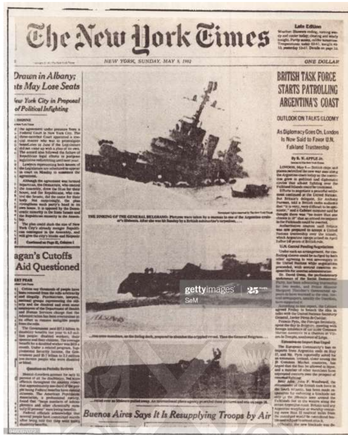
The New York Times, 9 de mayo de 1982

Fueron comunes las fotos de los soldados argentinos sonrientes y felices, como si se encontraran en un viaje con amigos. Pero ¿estas fotos representaban lo que realmente ocurría o lo que el gobierno quería?