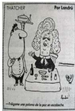
Fonte: Landrú, 27 maio 1982, p. 12 Pol.