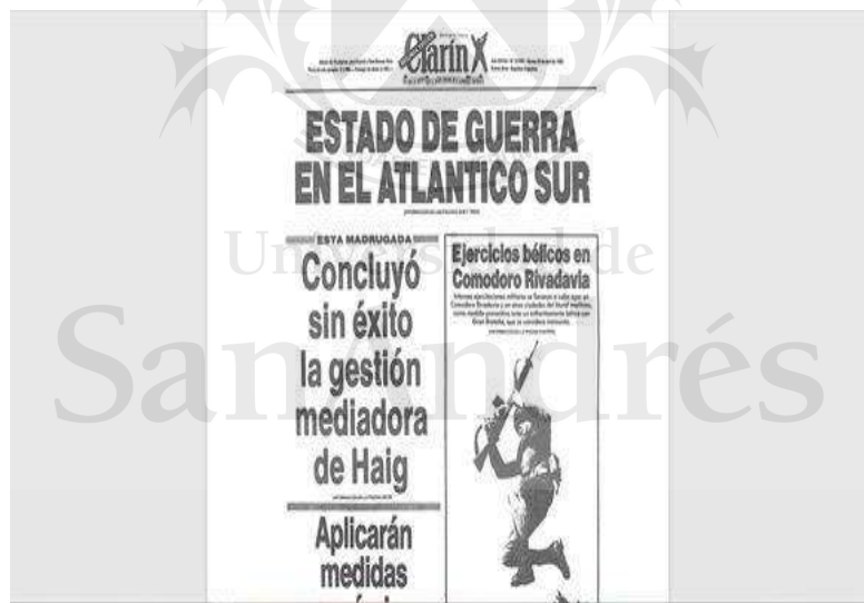
Diario Clarín, 30 de abril de 1982.

Así lo demuestran estas portadas que seleccionamos, a modo ejemplificativo: