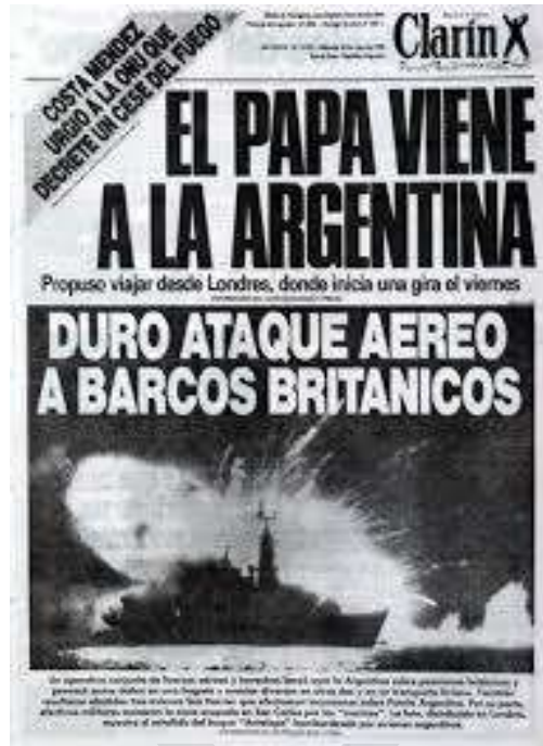
Diario Clarín, 26 de mayo de 1982

Dicho esto, no podemos dejar de advertir que gran parte de la sociedad de 1982, en cuanto receptor de esa información, asumió un rol pasivo creyendo, lo que los medios de comunicación le transmitían. Estamos frente a la comunicación unidireccional, que menciona Harold Dwight Lasswell, en la cual el comunicador emite un mensaje a la población y esta es pasiva en su reacción. El autor postula que para que la comunicación sea exitosa debe poder responder ¿Quién dice, qué, por qué canal, a quién y con qué efecto? Cada mensaje producido por los medios de comunicación tiene una intencionalidad determinada que, en 1982, era hacerle creer a la población de que los combatientes estaban preparados, que la Argentina tenía el armamento, provisiones para vencer a los ingleses, que el pueblo argentino conseguiría la victoria sobre el enemigo.