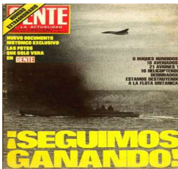
Revista Gente, 14 de junio de 1982.

También, se utilizó la publicidad oficial para reafirmar la idea de ayuda o participación colectiva para vencer a los ingleses, así lo demuestran estas imágenes: