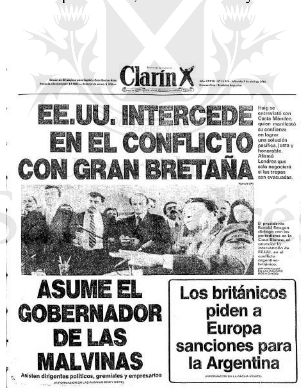
Diario Clarín, 7 de abril de 1982.

Perú, Venezuela, Cuba, Brasil, Nicaragua, Bolivia y República Dominicana fueron aliados amigos mientras que Francia, Estados Unidos y Chile apoyaron a Inglaterra.