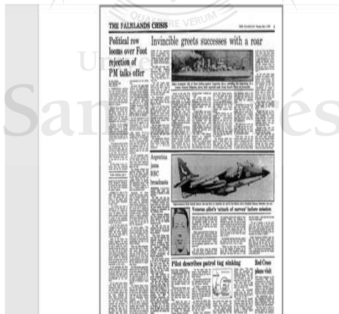
The Guardian, 4 de mayo de 1982

La portada del The New Times incluyó el día 9 de mayo las fotos del hundimiento del General Belgrano que la Revista Gente recién publicó el día 13 de igual mes.