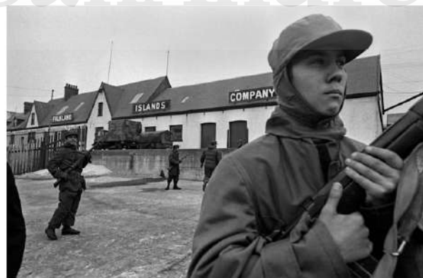
Figura 8: Malvinas, 3 de abril de 1982. Fotógrafo Omar Torres.

https://diarioprimeralineacom.ar/las-historias-de-los-soldados-chaquenos-identificados-en-malvinas/