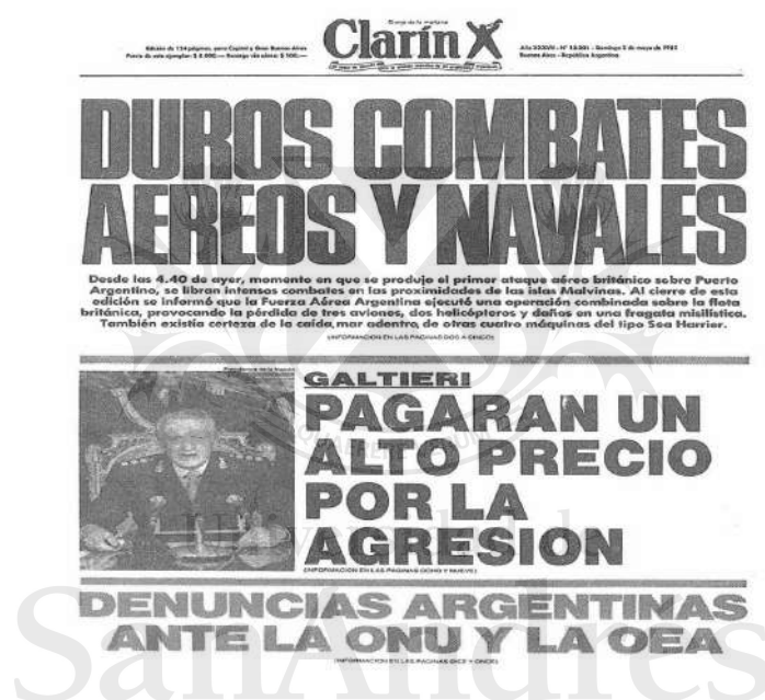
Diario Clarín, 2 de mayo de 1982

El Diario Clarín del 2 de mayo de 1982 decía " la fuerza argentina ejecutó una operación combinada sobre la flota británica provocando la pérdida de tres aviones, dos helicópteros y daños en una fragata misilística ".