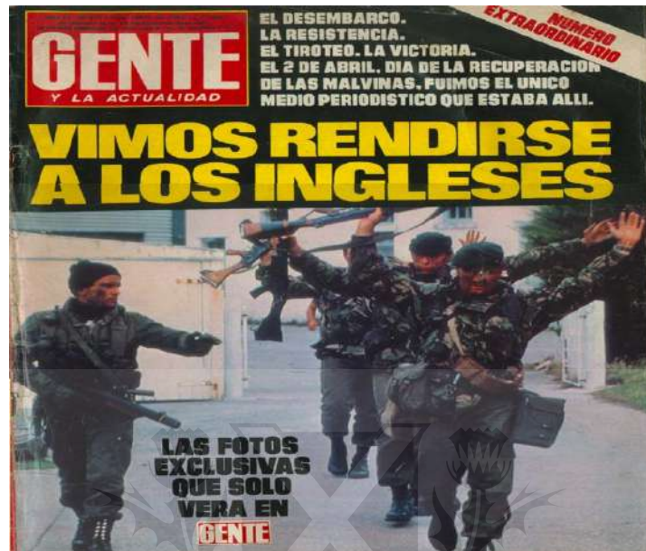
Revista Gente, 8 de abril de 1982

"estamos ganando". Se buscaba posicionar a la Argentina como un país ganador, capaz de vencer a Inglaterra.