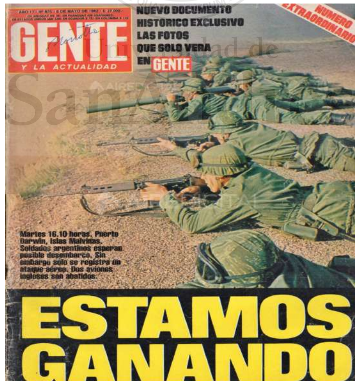
Revista Gente, 6 de mayo de 1982.