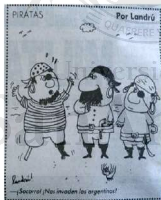
Imagen 2: Piratas

Así lo demuestran las siguientes imágenes.