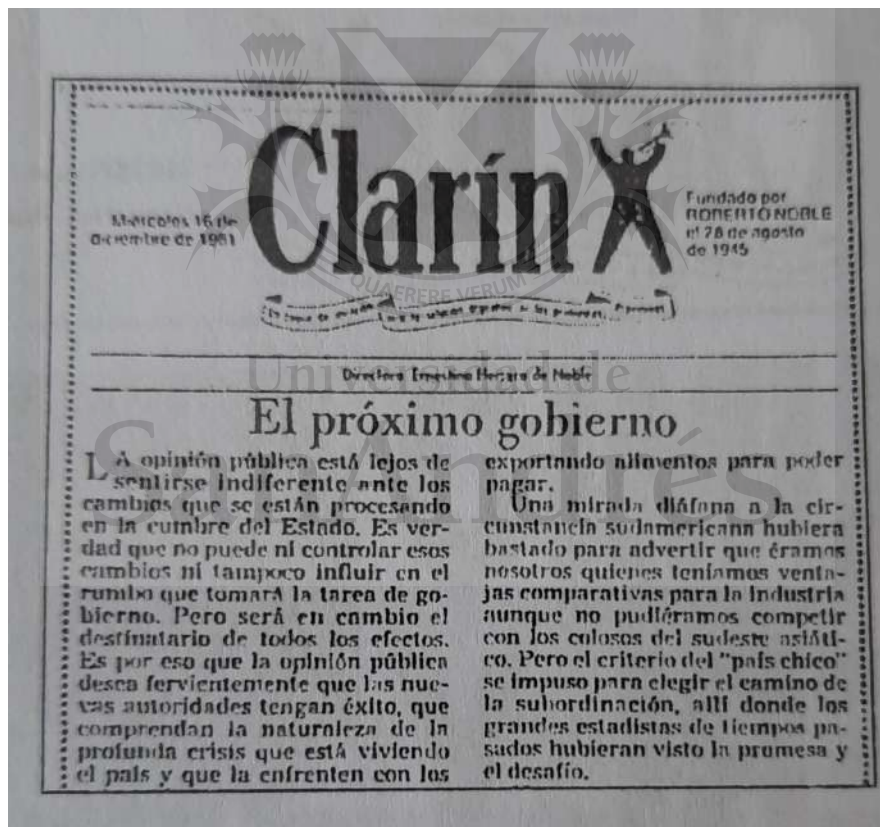
Diario Clarín, 16 de diciembre de 1981.

Como lo demuestran los diarios de la época, la Argentina bajo gobierno militar, atravesaba serios problemas políticos, económicos y sociales.