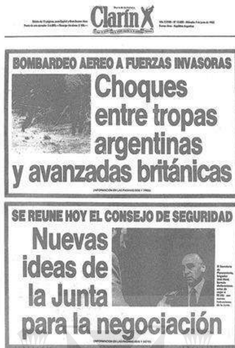
Diario Clarín, 2 de junio 1982