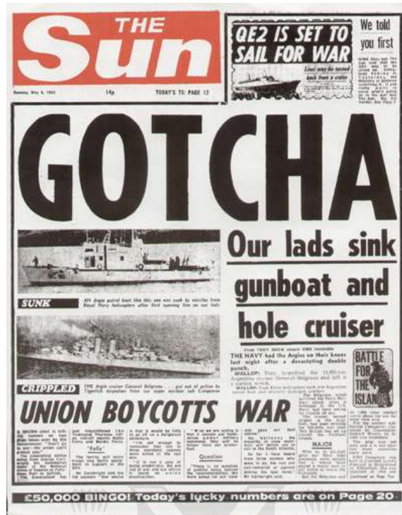
The Sun, United Kingdom, 4 de mayo de 1982