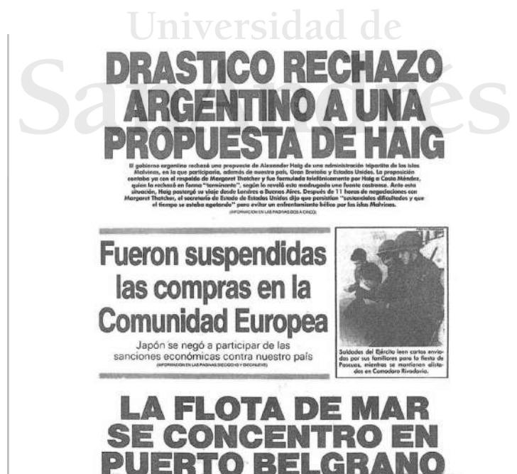
Diario Clarín, 13 de abril de 1982

La siguiente portada del Diario Clarín, del 13 de abril de 1982, nos demuestra como la imagen puede ser distorsionada.