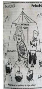
Fonte: Landrú, 25 maio 1982. 25Pol.