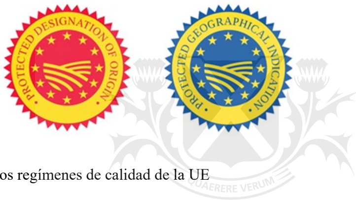
Sellos regímenes de calidad de la UE