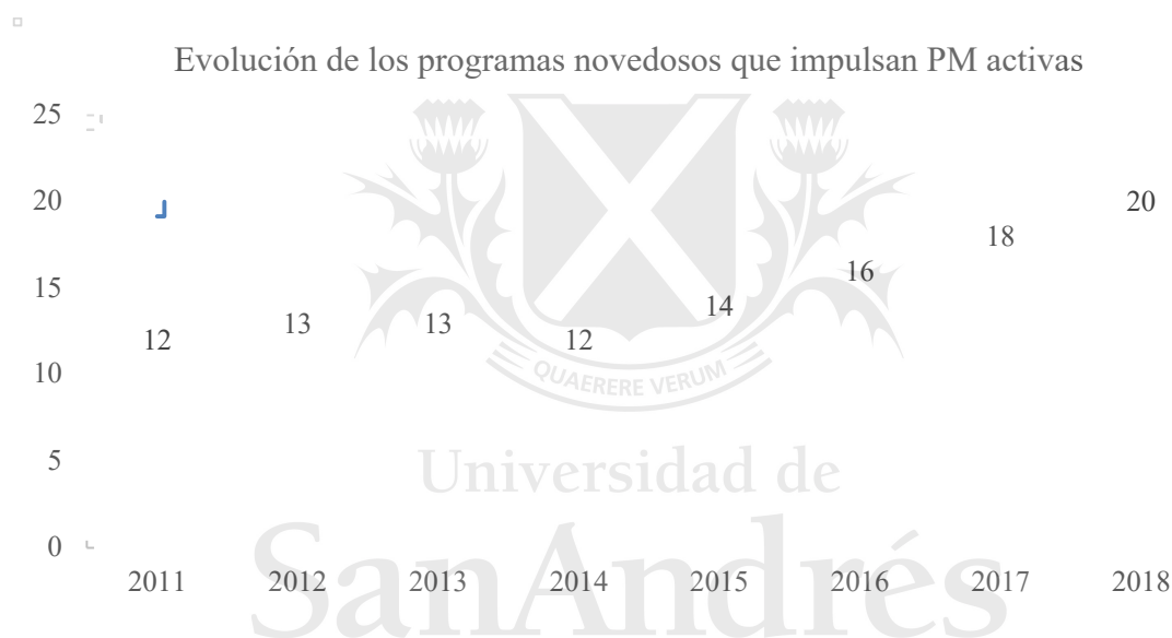
Gráfico 2: Evolución los programas novedosos que impulsan PM activas (2011-2018)

Fuente: elaboración propia en base a datos del cuadro 8.